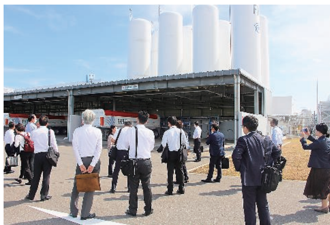
▲とうほう次世代経営者倶楽部 浪江町視察研修会の様子 福島水素エネルギー研究フィールド（FH2R）見学

東邦銀行グループが地域活性化に向けて活用する成長ドライバーは3つあるという。第1のドライバーは従来型コアビジネス（資金運用）を深化させることである。ここでの確実な収益に基づいて、第2のドライバーである幅広い分野のコンサルティング業務の高度化も、そして第3のドライバーの新事業領域の探索も可能となる。これら3つのドライバーをさらに磨き上げて、地域の活性化に向けてより一層貢献することを通して、地域にとってなくてはならない銀行グループになるべく、4月から始まる新年度、そして2030年を目指して、新たな挑戦に動き出している。